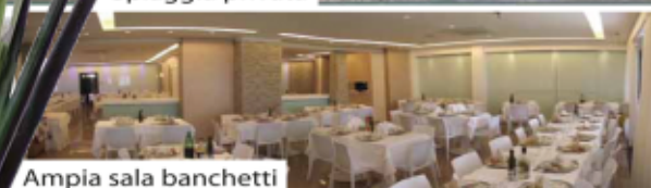
Ampia sala banchetti